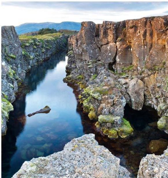
辛格维利尔国家公园