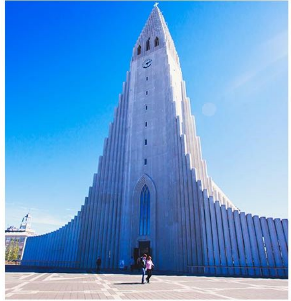
雷克雅未克大教堂